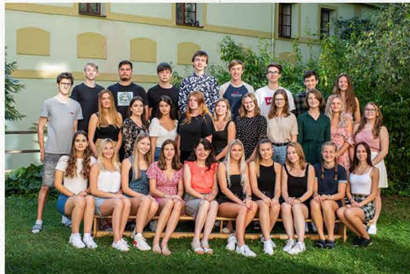
Obchodní akademie, Husova 1, České Budějovice 3A září 2020